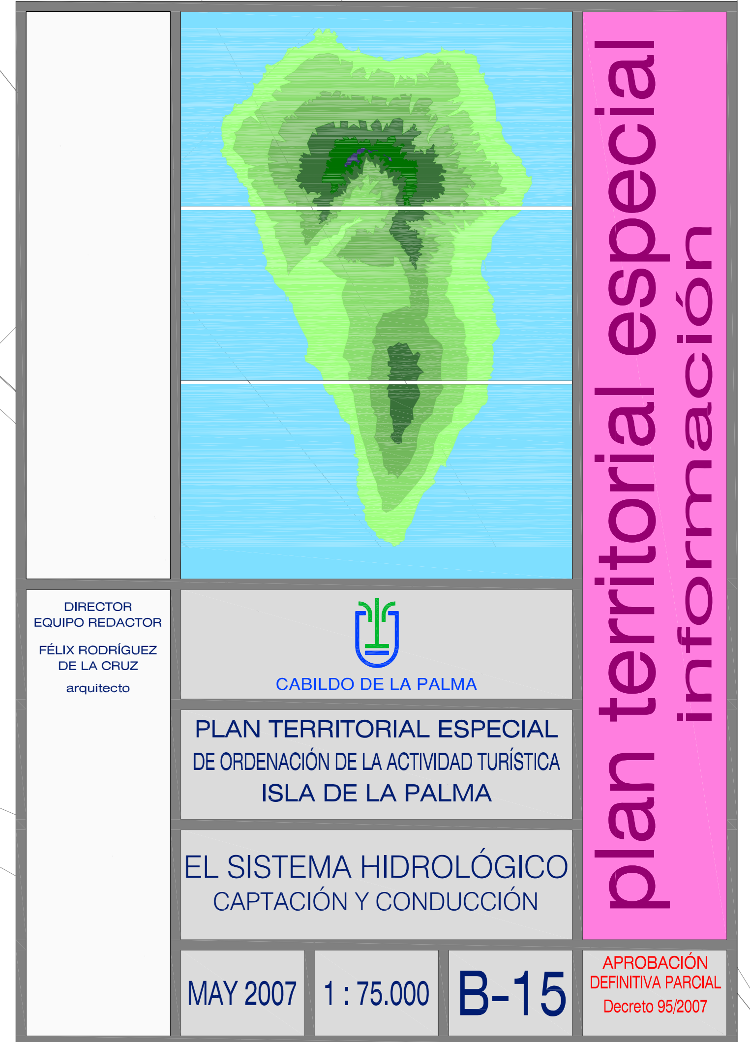
PLAN HIDROLÓGICO CONDUCCIÓN